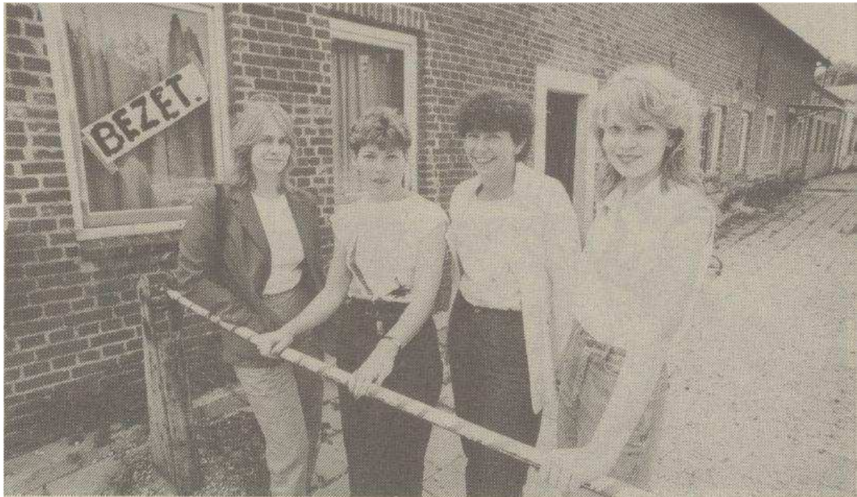
Ex-werkneemsters voor het confectie-atelier in Schinveld, dat zij zes dagen — tevergeefs — bezet hebben gehouden.